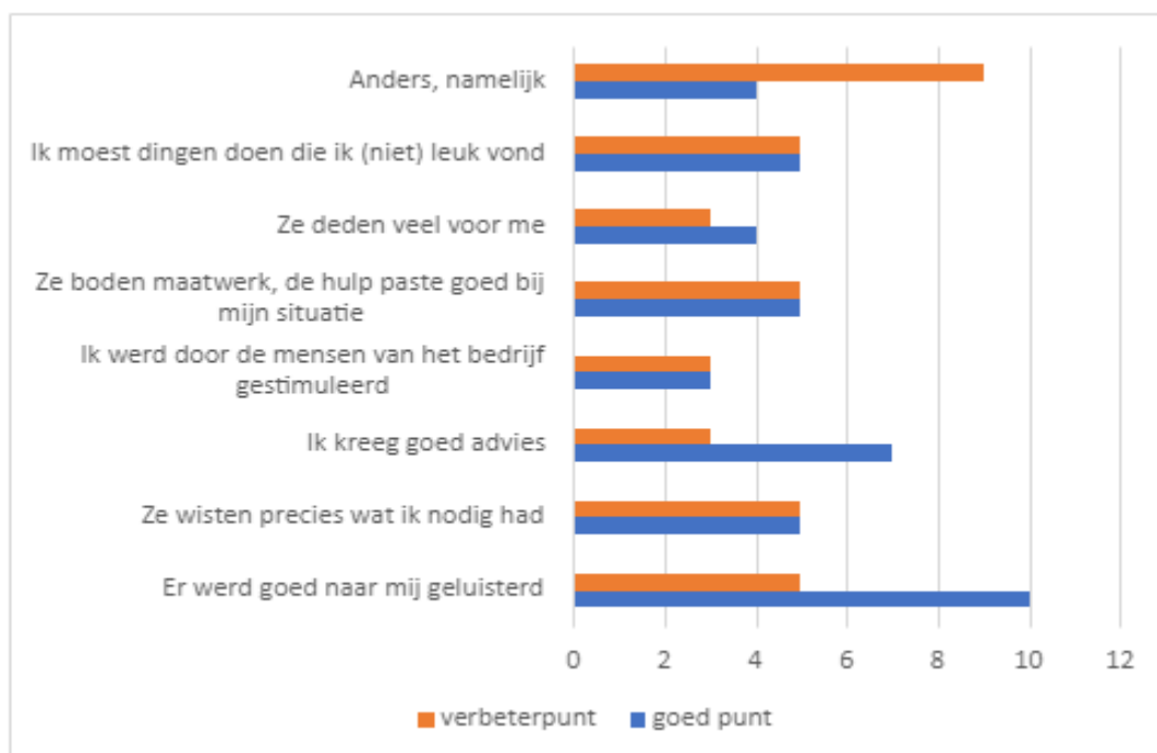
Figuur 3.2 Wat vond u goede punten van en wat zijn verbeterpunten voor de hulp van het private re-integratiebedrijf (N=22) (a)